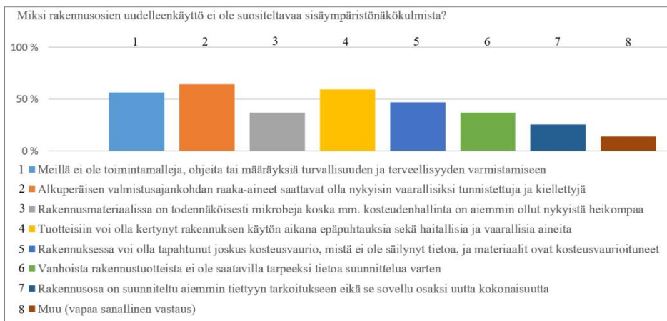
Kuvio 1. Kyselyn kysymys 4 ja vastausten prosentuaalinen jakauma.

Kysymyksistä 1 ja 2 voidaan tehdä seuraavia koonteja: 54 vastaajaa ilmoitti pääasialliseksi työtehtäväkseen rakennusterveysasiantuntija tai vastaava. Näistä 30 (56 %) ilmoitti ettei heillä ole kokemusta tai juurikaan tietämystä uudelleenkäytöstä ja 4 (7 %) oli työskennellyt useissa uudelleenkäytön hankkeissa.