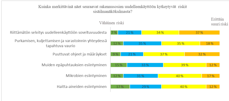
Kuvio 2. Kyselyn kysymys 5 ja vastausten prosentuaalinen jakauma.

Kysymyksen 4 sanallisissa vastauksissa (n=17) toistuivat seuraavat teemat: Hyväksymiskriteerit (tms.) puuttuvat (n=3), ohjeistukset ja tieto ovat vajavaisia (n=3), riskit ovat materiaali- ja kohdekohtaisia (n=3).